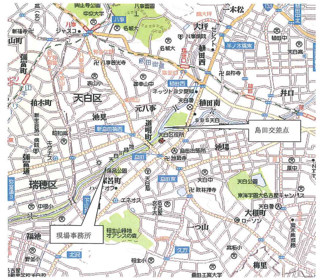
【奥村・大豊・村本 JV 工事事務所案内図】

工事事務所名 奥村・大豊・村本特別共同企業体 住所 〒468-0041 名古屋市天白区保呂町1601番地 TEL 052-800-5580 FAX 052-805-5655 備考 地下鉄桜通線新瑞橋駅より名古屋市営路線バス「平針住宅行き」「島田住宅行き」「島田一ツ山行き」「相生山住宅行き」にて島田下車。島田交差点を野並方向(南西方向)約800m菅田交差点を右折100m。